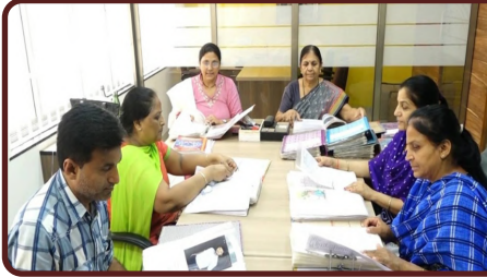
← મેરેજ બ્યૂરો