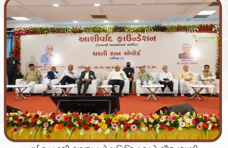
વર્ષ ૨૦૦૯થી ગુજરાતનો પ્રતિષ્ઠિત અને ગૌરવશાળી “ધરતી રત્ન એવોર્ડ” સૌ પ્રથમ શરૂ કરવાનું ગૌરવ.