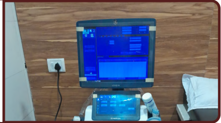
સોનોગ્રાફી વિભાગ →