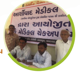
વિનામૂલ્યે મેડિકલ કેમ્પ ૨૪૧૫૫ લાભાર્થી