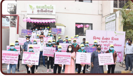
વિશ્વ કેન્સર દિવસની ઉજવણી : ૦૪-૦૨-૨૦૨૨