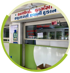
ફાર્મસી શોપના ૩૭૪૭૦ લાભાર્થી