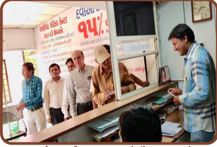
વર્ષ ૨૦૧૪થી અમદાવાદ ખાતે સૌ પ્રથમ દવાઓ ઉપર ૧૫% છૂટ અત્યાદે ૨૫% છૂટ.