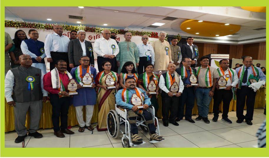
મુખ્ય મહેમાન મા.મુખ્યમંત્રી શ્રી ભુપેન્દ્રભાઈ પટેલ સાથે ઘરતી રત્નો