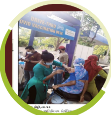
ક્રાઇવ થુ વેક્સીનેશન પ્રોગ્રામ ૮૫૭૦ લાભાર્થી