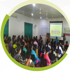
બ્રેસ્ટ કેન્સર જાગૃતિ અભિયાન ૧૩ પ્રોગ્રામ ૯૮૦ લાભાર્થી