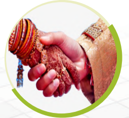
મેરેજ બ્યૂરો ૫૩૪ લાભાર્થી

વર્ષ : ૧૯૯૬-૯૭ થી ૩૧-૦૩-૨૦૨૨ સુધી લાભાર્થીઓની સંખ્યા