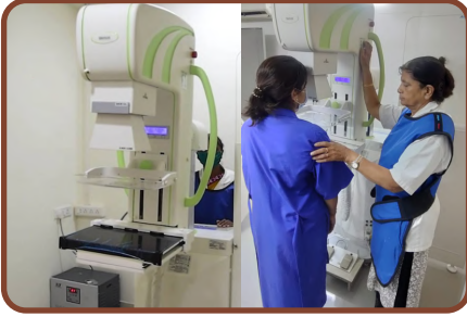
વર્ષ ૨૦૧૯થી સ્તન કેન્સર મેમોગ્રાફી-સોનોગ્રાફી બજાર કિંમત રૂ.૩૦૦૦/- સામે સૌ પ્રથમ રૂ.૩૦૦/- માં