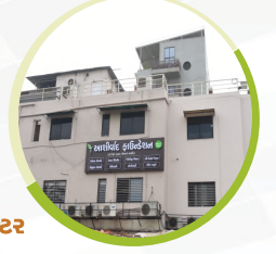
આશીર્વાદ મેડીકલ સેન્ટર ૧૩૫૩૫ લાભાર્થી