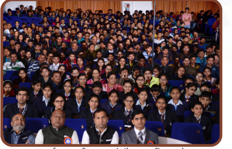
વર્ષ ૨૦૧૫થી ભારતમાં સૌપ્રથમ- વિનામૂલ્યે કેસીયર ઈલ મેડીસીન કોન્ફરન્સ