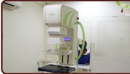
← મેમોગ્રાફી વિભાગ