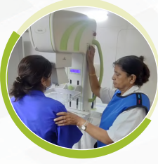
બ્રેસ્ટ કેન્સર નિદાન અભિયાન મેમોગ્રાફી-સોનોગ્રાફી :૯૨૭ લાભાર્થી

»» Services of Ashirvad Foundation with Beneficiaries «« Year 2021-22. Total Beneficiaries - 89,124